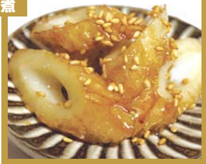
レシピ/PNもっちゃん